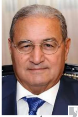
عبد الحميد أبو موسى

ومن الجدير بالذكر أن قائمة فوربس الشرق الأوسط ضمت أقوى خمسين شركة مصرية تعكس قتل الشركات المدرجة في السوق، حيث سجلت الشركات مجتمعة قيمة سوقية تقدر بنحو 55.8 مليار دولار وتشكل حوالي 83% من إجمالي القيمة السوقية للشركات المدرجة في البورصة، ويعد قطاع البنوك والخدمات المالية الأكثر تمثيلاً في هذه القائمة بنحو 14 شركة وبقائمة سوقية إجمالية بلغت 21.2 مليار دولار، متقدماً على القطاع الصناعي الذي حل